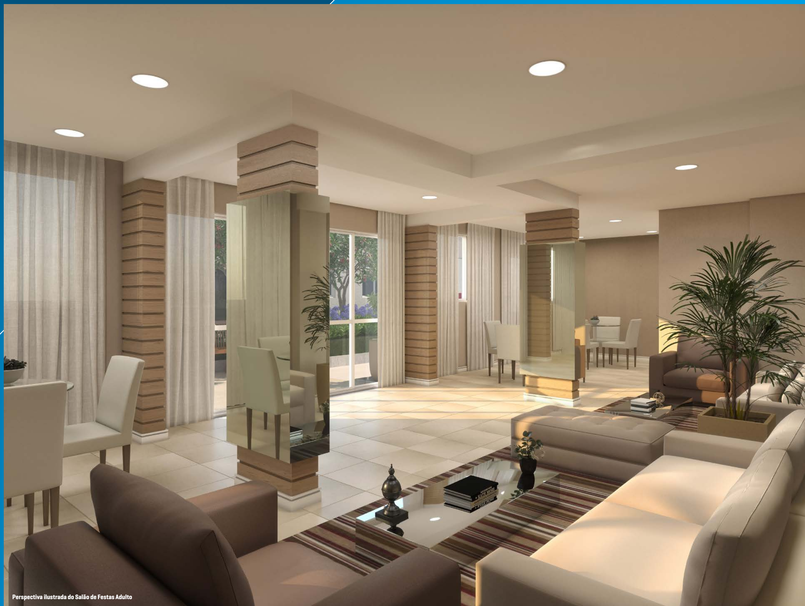
Perspectiva ilustrada do Salão de Festas Adulto

PODE COMEMORAR. AGORA VOCÊ TEM LUGARES ESPECIAIS PARA FAZER A FESTA.