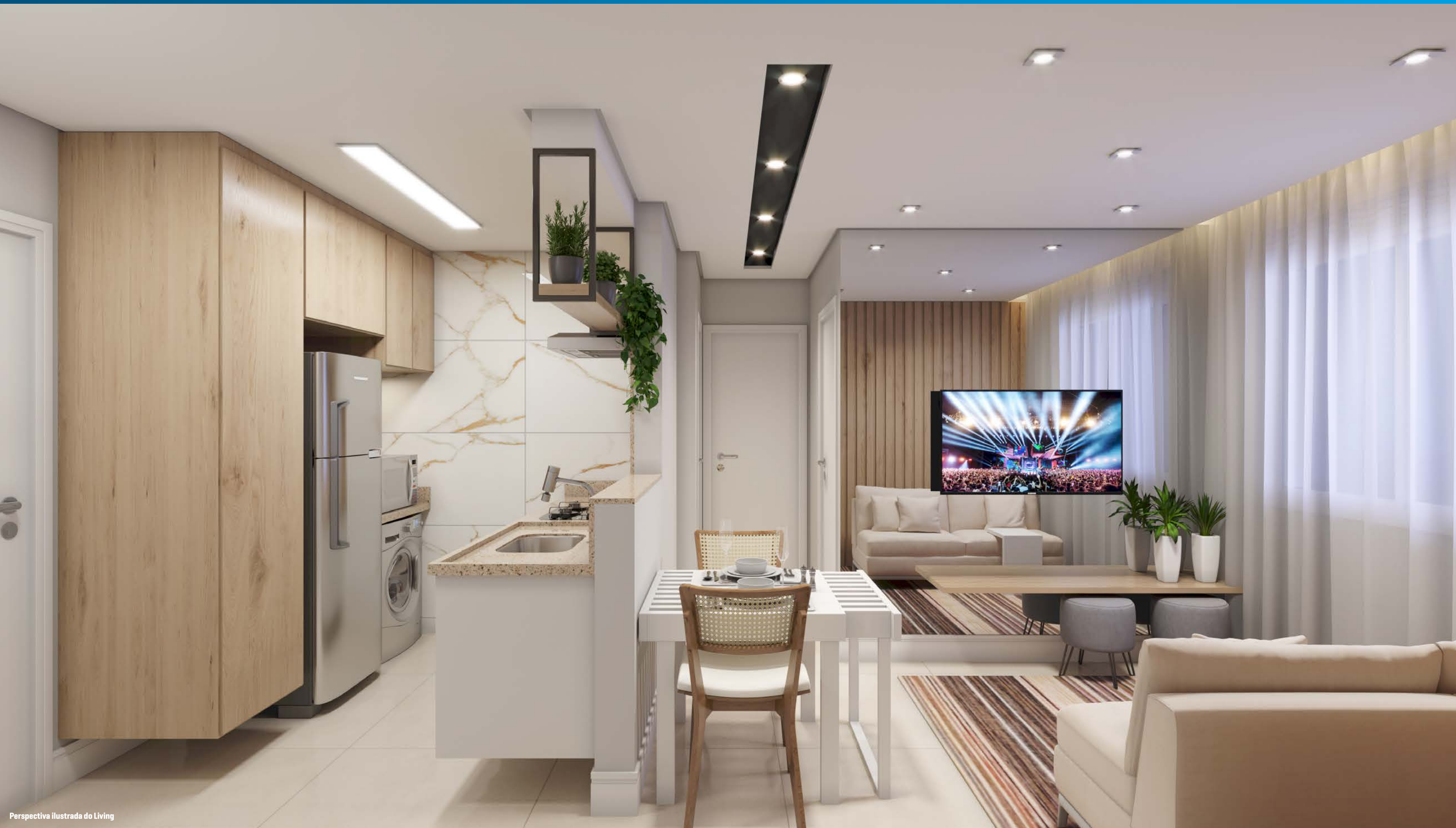
Perspectiva ilustrada do Living