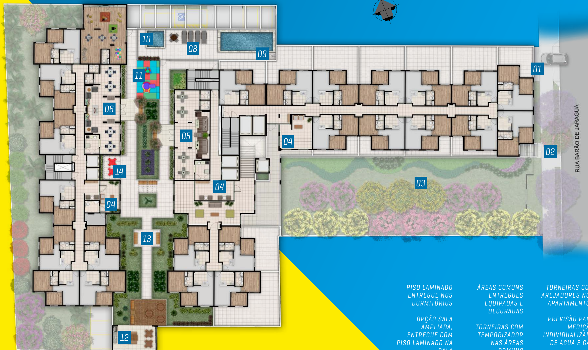
Perspectiva ilustrada da Implantação