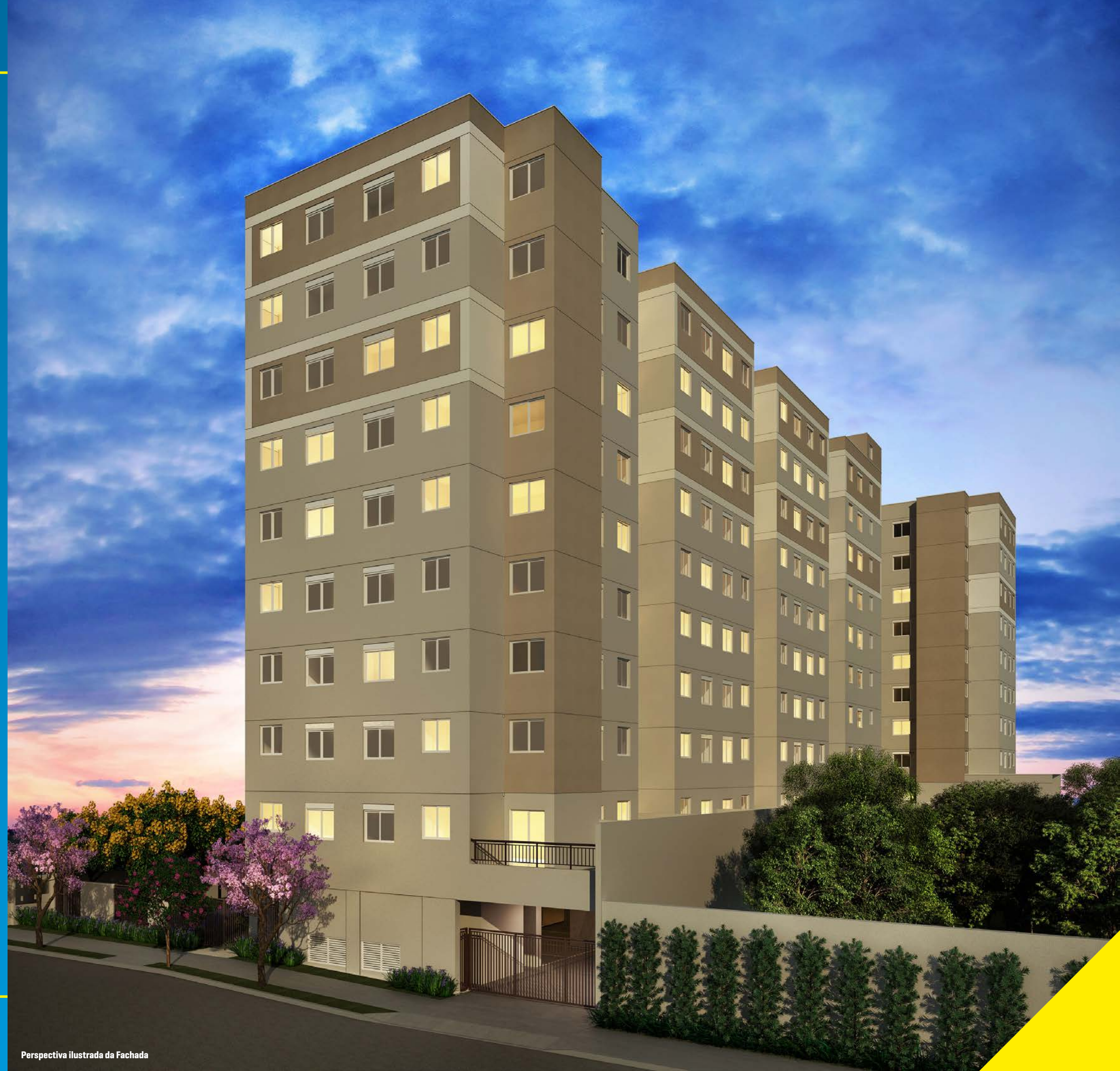
Perspectiva ilustrada da Fachada