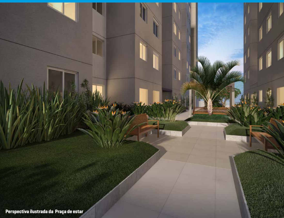
Perspectiva ilustrada da Praça de estar

UM AMPLO BICLETÁRIO EXCLUSIVO PARA GUARDAR SUA BIKE E APROVEITAR TODA A MOBILIDADE QUE O BAIRRO OFERECE, ALEM DE UMA PRAÇA CHARMOSA COM BANCOS E PERGOLADOS QUE INSPIRAM A TRANQUILIDADE E CONVIVÊNCIA.