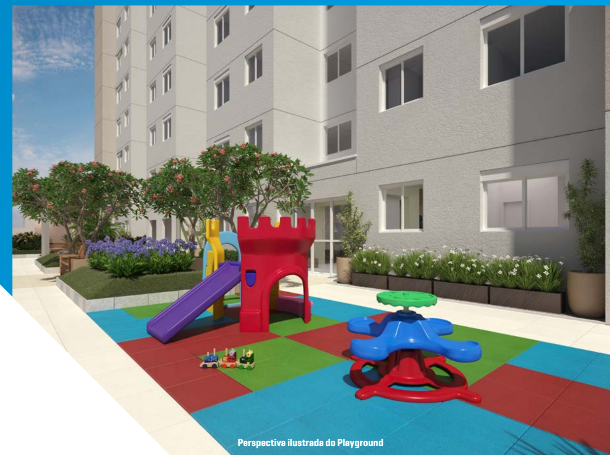
Perspectiva ilustrada do Playground