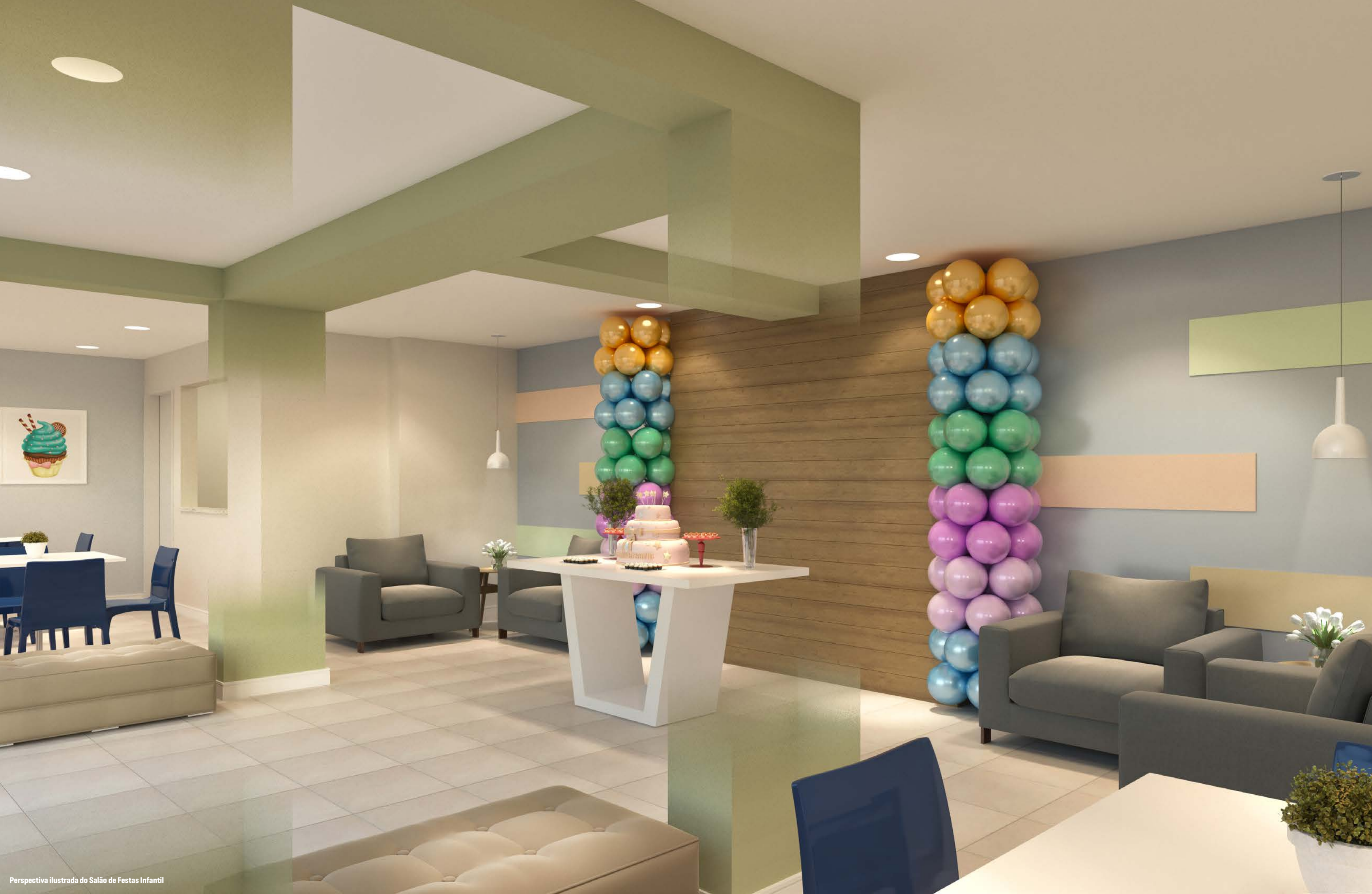
Perspectiva ilustrada do Salão de Festas Infantil