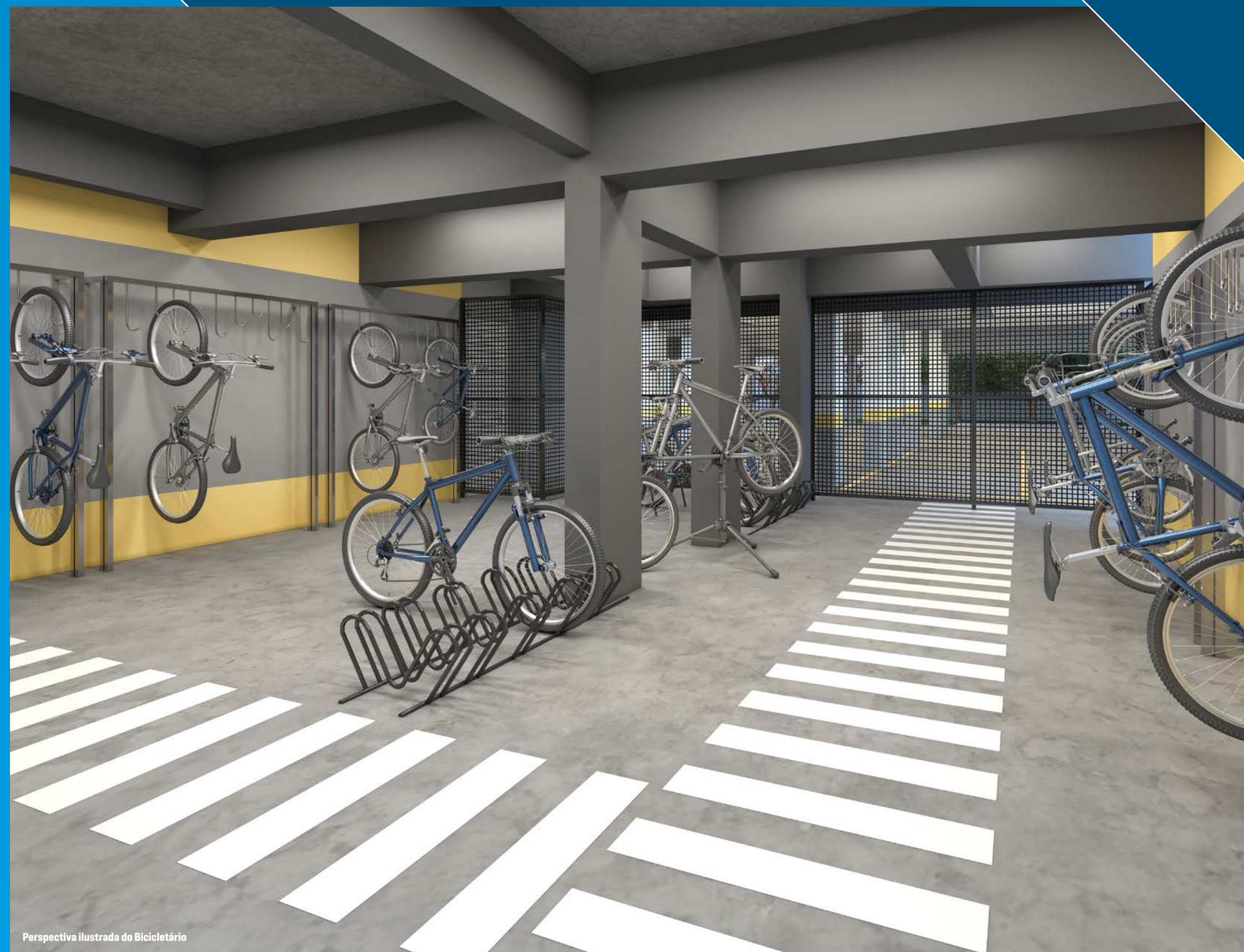
Perspectiva ilustrada do Bicletário